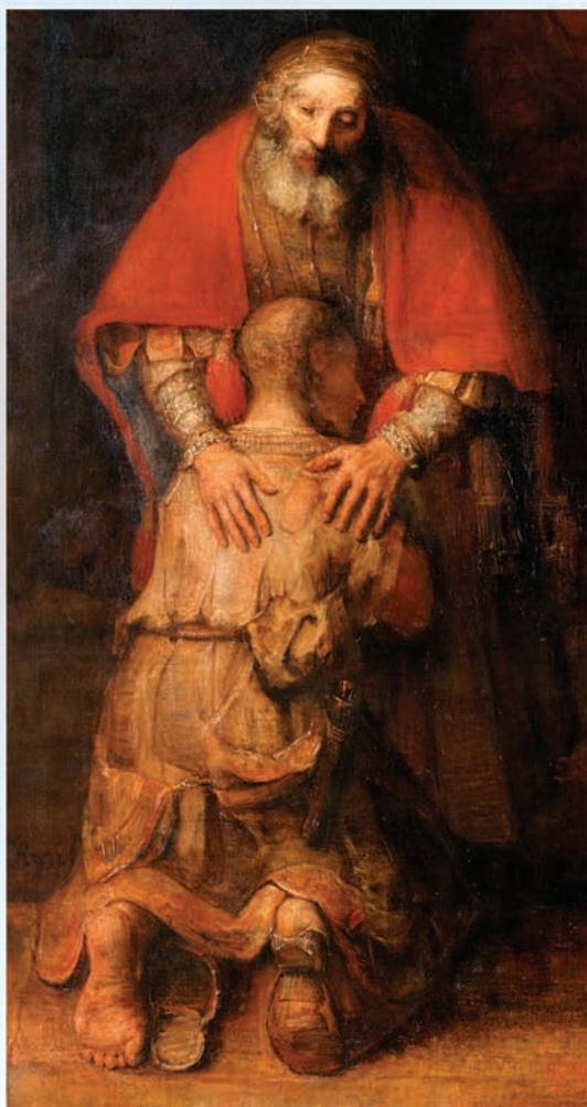
Rembrandt Harmensz. van Rijn, 'De Terugkeer van de Verloren Zoon'

Eeuwige scheiding en eeuwige verdoe- menis zijn helemaal in tegenspraak met Gods Beginsel van de Schepping. God, die van ons houdt met een vergevend en ouderlijk hart, kan het simpelweg niet verdragen om van Zijn kinderen gescheiden te zijn. Dat God zo voelt beschrijft Jezus in de parabels van de verloren zoon (Lk. 15:11-32), van het verloren schaap en van het verloren muntje (Lk. 15:1-10). Het is dus ook niet God die ons oordeelt, maar we oorde- len onszelf wanneer we tegen Zijn schep- pingsbeginselen ingaan.