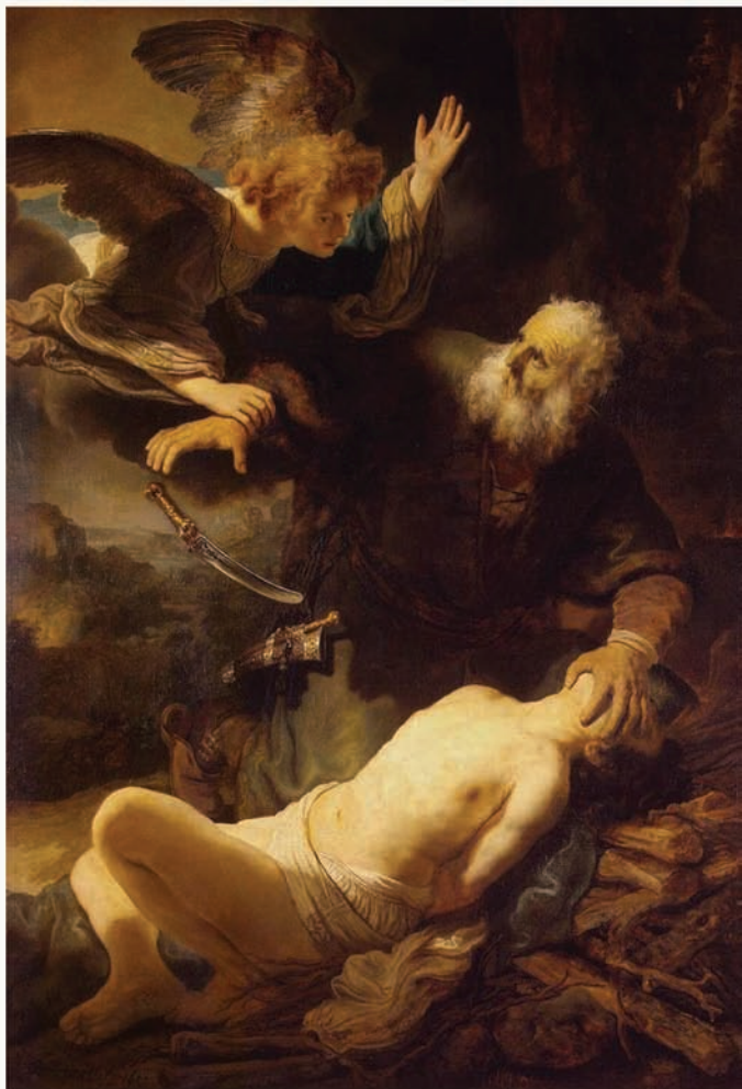
Schilderij: 'Het offeren van Isaak', Rembrandt Harmenszoon van Rijn, 1635

Satan had op dit moment echter al meerdere naties onder zijn bestuur. Daarom was dit succesvolle fundament op gezinsniveau niet voldoende voor God om de mensheid te bevrijden van Satans onderdrukking. Hij moest nu ook een volk vinden dat het fundament voor de Messias op nationaal niveau legt. Daarom begon hij de Israëlieten op deze taak voor te bereiden.