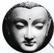
SIDDHARTHA GAUTAMA ongeveer 400 BC

Daarnaast bereidde God vanaf ongeveer vier eeuwen voor Jezus' geboorte de wereld door religieuze en ethische bewegingen innerlijk op de komst van de Messias voor.