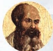
MALEACHI ongeveer 400 BC

In China verscheen Confucius die een hoog ontwikkeld ethisch humanisme onderwees. Lao-Tse onderwees de traditie van het Taoïsme .