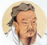
CONFUCIUS ongeveer 500 BC

In India verwierp prins Siddhartha Gautama (Boeddha) de wereldse overvloed van zijn tijd, terwijl hij naar de ware levensweg zocht. Door zijn voorbeeld en leer ontwikkelde zich het Boeddhisme , dat tot een van de meest invloedrijke religies in de oosterse wereld uitgroeide.