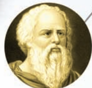
SOCRATES ongeveer 400 BC

Maleachi , de schrijver van het laatste boek van het Oude Testament, voorspelde dat de beroemde profeet Elia, die negen eeuwen vóór Christus leefde, naar Israël zou terugkeren 'voordat de Dag des Heren komt'. Hiermee schiep hij concrete messiaanse verwachtingen onder het Joodse volk.