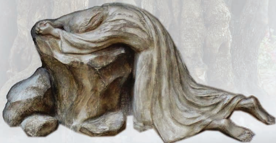
Houtsnede: 'Jezus' gebed in de Hof van Getsemane', geplaatst in de Hof van Getsemane in Jeruzalem.

Zo zou een laatste kans gecreëerd zijn om Gods oorspronkelijk plan te vervullen: Gods rijk op aarde realiseren tijdens Jezus' leven. In dat geval had Jezus niet de weg van het ultieme offer hoeven gaan. Maar de apostelen sliepen, en er was geen verbinding met Jezus van hart tot hart. Jezus bleef alleen achter. Er was niemand die hem steunde. De weg van het kruis was nu onvermijdelijk.