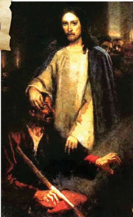
Vasily Surikov - 'Jezus geneest de blindgeborene'

Voor de joodse leiders werd Jezus' optreden een toenemende ergernis. Ze begonnen een handlanger van de duivel in hem te zien, en weerhielden de mensen ervan om zich bij hem aan te sluiten. 'Hij kan die demonen alleen maar uitdrijven dankzij Beëlzebul, de vorst der demonen' (Matheus 12:24). Na enige tijd zochten ze zelfs naar een gelegenheid om voorgoed van Jezus af te komen door hem te doden.