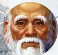
LAO-TSE ongeveer 500 BC

In Griekenland streefden de grote klassieke filosofen Socrates, Aristoteles en Plato naar de vestiging van universele normen voor menselijke kennis en ethiek .