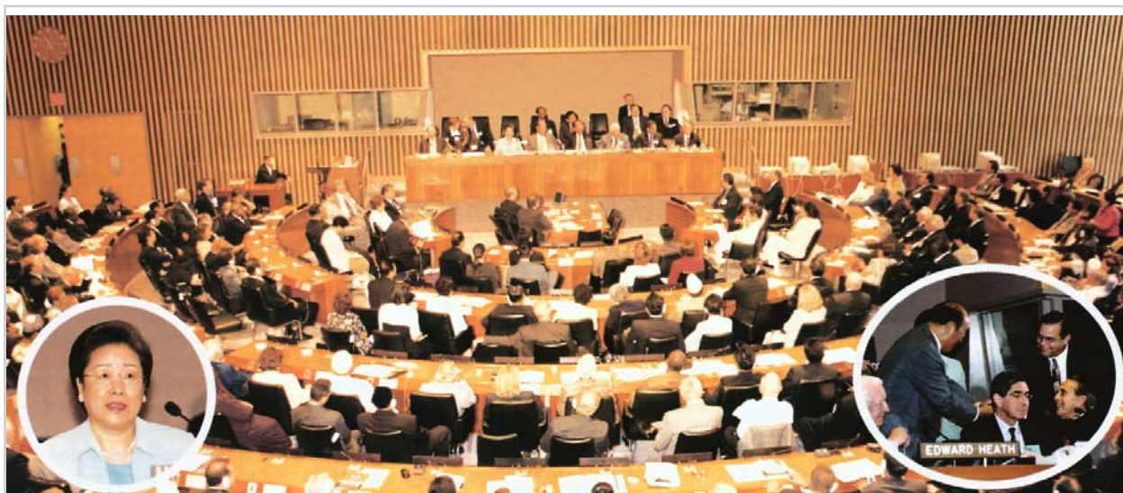
Assemblee 2000 in het hoofdkantoor van de Verenigde Naties te New York. Inset 1: Mevr. Moon tijdens haar toespraak. Inset 2: Rev. Moon schudt de hand van senator Bob Dole

Dames en heren, geëerde gasten en vooraanstaande leiders,