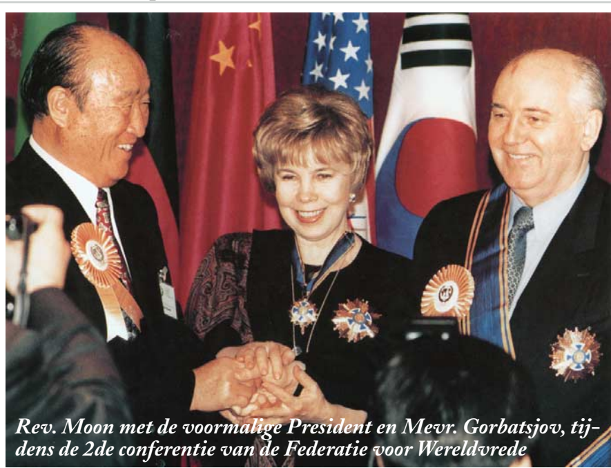
Rev. Moon met de voormalige President en Mevr. Gorbatsjov, tijdens de 2de conferentie van de Federatie voor Wereldvrede

Het menselijke ideaal om eenheid van lichaam en geest te bereiken kan alleen dan gerealiseerd worden, als mensen geheel Gods Ware Liefde bezitten. Het Bijbelse vers, "Gezegend zijn de vredestichters, want zij zullen Gods kinderen genoemd worden", licht dit punt toe.