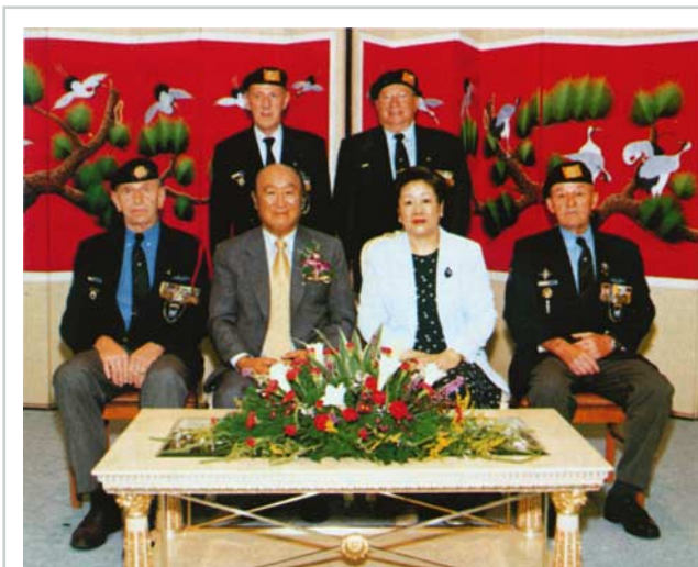
Rev. Moon en zijn vrouw poseren met Koreaanse oorlogsveteranen uit Nederland

Om zulke gebieden van vrede, vrijheid en ecologische harmonie te stichten, zullen de betrokken landen bereid moeten zijn het benodigde land te verstrekken. Dit is geen eenvoudige zaak, want er zal tegenwerking zijn om het benodigde land over te dragen, zelfs voor een zone van vrede. Ik heb erg veel moeite gedaan om een oplossing te vinden voor dit probleem, vooral omdat dit ook geldt voor mijn geboorteland, Korea.